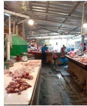
Gambar 4.3 Meja penjual ikan dan ayam di Pasar Bantar Gebang

Ada banyak barang yang di jual di Pasar dan diantaranya adalah ikan, daging dan ayam. Dimana ketika pengunjung yang membeli pastiharus menunggu sangat lama dan ada kegiatan memotong yang dimana alas meja harus kokoh dan area dagang juga harus bisa memperlihatkan bahwa barang yang di jual terlihat fresh dan bersih. Dinding dan lantai harus bisa mudah di cuci. Peraturan baru di Inggris mengharuskan pemasangan kaca dibagian depan toko. Alas meja kerja sebaiknya terbuat dari marmer, kaca atau keramik (Neufert, 196).